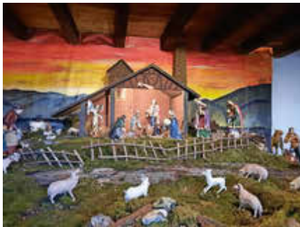
St. Katharina, Nievern