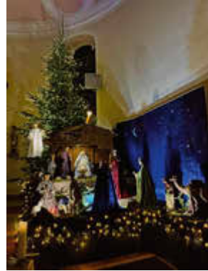
St. Willibrord, Winden