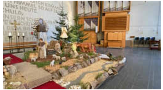
Heilig Geist, Braubach