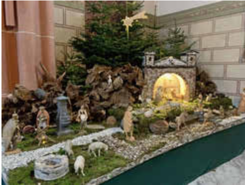
St. Martin, Bad Ems