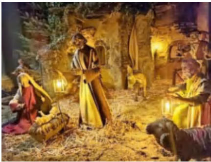
St. Martin, Oberlahnstein