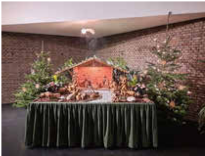
St. Bonifatius, Nassau