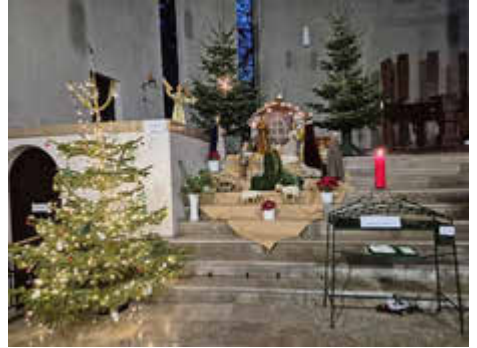
St. Barbara, Niederlahnstein