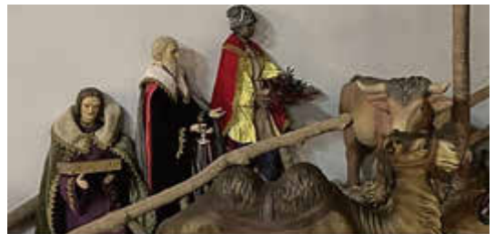
St. Anna, Seelbach